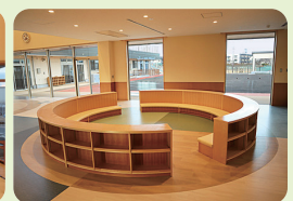
読み聞かせコーナー

時 とき 所 ところ 内 内容 対 対象 費 費用・金額 ※ 記載のないものは「無料」 定 定員 持 持ち物 申 申し込み ※ 記載のないものは「当日、直接会場へ」 問 問い合わせ