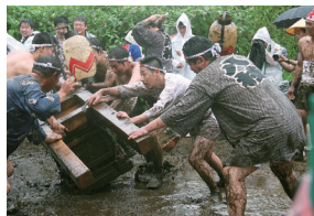
平方祇園祭のだろいんきょ行事

だろいんきょとは、いんきょ神輿と呼ばれる装飾のない白木の神輿を、あらかじめ水をまいておいた神酒所の庭で転がすことをいいます。いんきょ神輿も転がす若い衆も泥だらけになりながら行うこの祭りは、平成23年3月18日に県指定無形民俗文化財に指定されました。