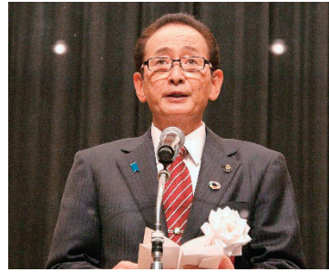
あいさつする市長

会場では、仲間たちとの久々の再会に喜び、あふれる笑顔や涙する皆さんに、私も深く感動いた