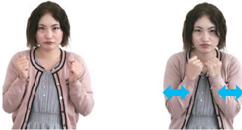
両手のこぶしを握り、左右に震わせる

日常生活で使える手話を一緒に学びませんか。市ホームページでは手話動画を公開中です。今月は「冬・寒い」を紹介します。