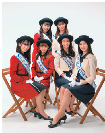
2022フレッシュあげお

①～③の全てに該当する人 ①市内に在住・在勤・在学の令和5年4月1日時点で18歳以上 ②1年間(令和5年4月1日～令和6年3月31日)、上尾商工会議所などの公式行事など、PR活動に責任をもって参加できる ③特定の興行会社または他団体と類似契約をしていない 甲上尾商工会議所青年部のホームページの応募フォームから送信または応募用紙(上尾商工会議所にある)に必要な事項を記入し、写真(全身・上半身、各1枚)を添付して、令和5年1月13日まで(当日消印有効)に直接または郵送で、上尾商工会議所青年部(〒362-8703ニツ宮750)へ