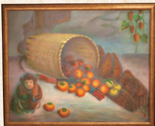
『収穫の喜び喜び』 浅野 光三