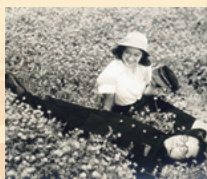
『わが青春に悔なし』

●チケット販売 時12月3日(土)9時～ 所コミュニティセンター、イコス上尾、あげお お土産・観光センター 費各500円(自由席) ※席数を制限しています。未就学児は入場できません。