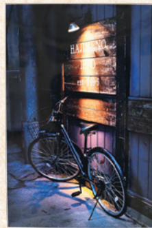
『セレナーデ』 生熊 昌彦