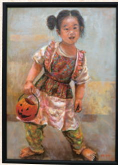
『嬉々として』 田中 重夫