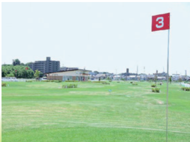
戸崎公園パークゴルフ場