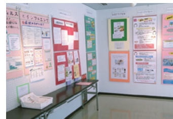
昨年のミニ消費生活展

【】 市役所ギャラリー 【】 消費生活センター(0781-0800・0781-4600)