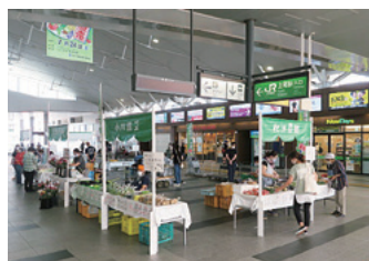
昨年のあげお朝市

安全な野菜、季節の花や果実、飲むヨーグルトなどを数多く取りそろえています。 【】 朝市/毎月第4(土)10～12時 【】 夕市/4月28日(木)、6月3日(金)、12月9日(金)のいずれも16～18時 【】 JR上尾駅自由通路 【】 あげお朝市実行委員会(農政課内)(0781-7384・0781-9872)