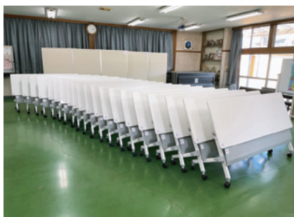
下芝自治会に整備した集会所備品