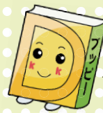
あっぴいぶっくるのキャラクター「アッピー」

子どもの読書活動支援センター 【開館時間】 10:00～16:30 所 柏座4-3-8富士見小学校内 電話・773-3711