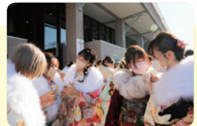
令和4年の上尾市成人式

上尾市では、引き続き20歳になる人を対象に式典を実施します。詳しくは下表をご覧ください。