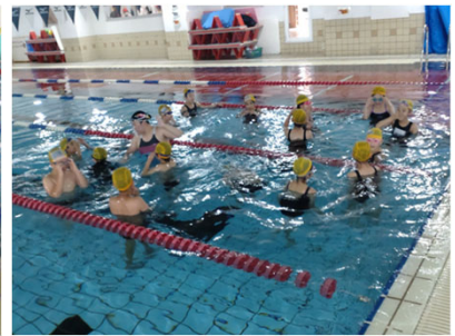
【上尾スウィンスイミングスクール】