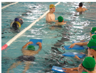
【スウィン大教スイミングスクール大宮東】