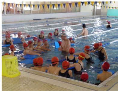
【ウイングスイミングスクール上尾校】