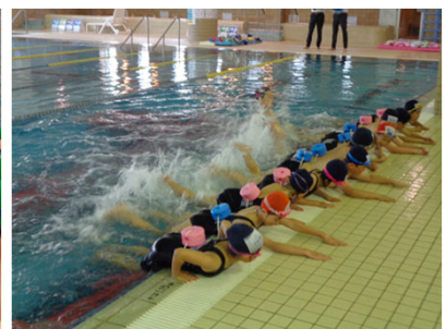
【コナミススポーツクラブ北上尾】