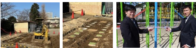
150周年記念事業実行委員会会長さんとPTA会長さんでテープカット

【防犯カメラ等増設】 校舎の構造上（校門、昇降口が多い）、学校敷地内や校舎内への入り口が多く、防犯上心配な点があった為、防犯カメラとモニターを増設していただきました。昨年度に引き続き、門や昇降口の開閉や入校時の名札着用についても、ルールを徹底し、児童の安全を守りたいと思います。