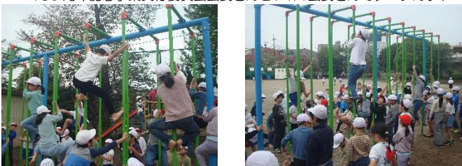
初めの日、20分休みは大盛況でした