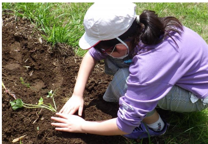
さつまいも ほん 60本