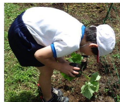
きゅうり ほん 12本