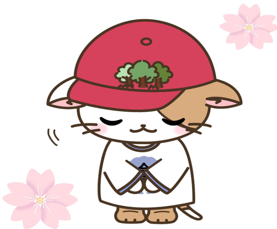
今泉小学校キャラクター 「いまにゃん」