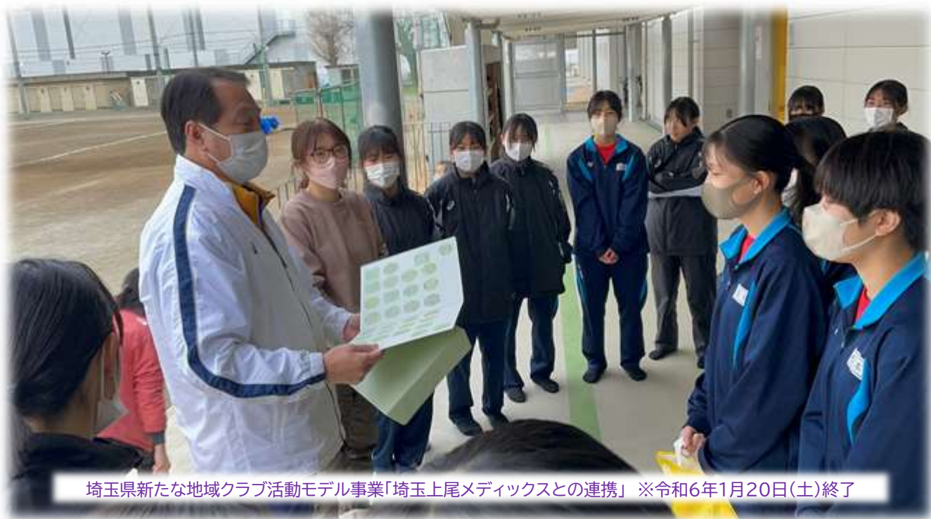
埼玉県新たな地域クラブ活動モデル事業「埼玉上尾メディックスとの連携」 ※令和6年1月20日(土)終了