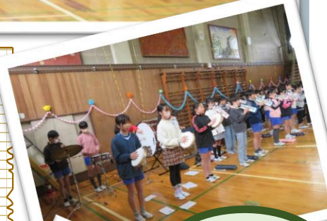
気持ちを一つにして、演奏します♪

「6年生を送る会」直前の姿です。体育館で、最後の練習をしました。 『6年生へ贈る言葉』も合奏も、段々と上達してきました。本番が楽しみです。 最高学年のバトンをしっかり引き継げるように、頼もしい姿を見せましょう。