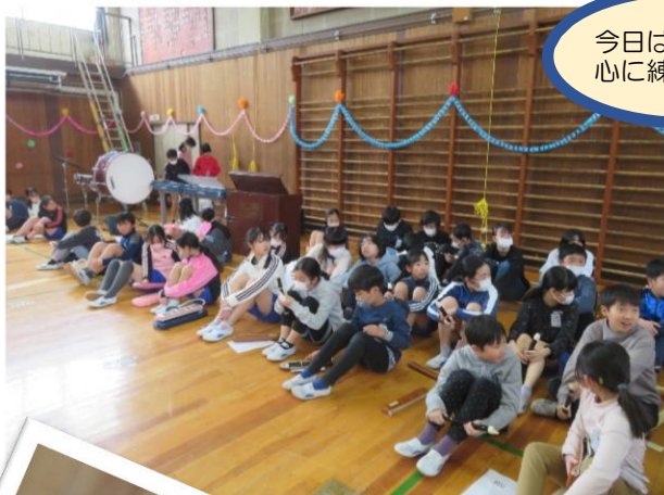
今日は合奏を中心に練習だ♥