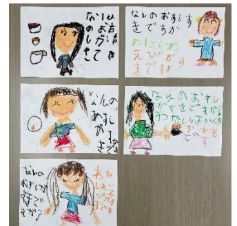
(千葉県南部の幼稚園からのメッセージ)