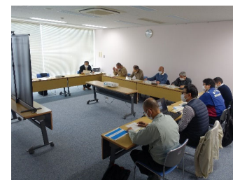
第3回上尾市かわまちづくり勉強会