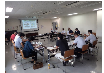
平方地区かわまちづくり勉強会 (8/26)