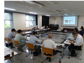
平方地区かわまちづくり勉強会 (8/25)