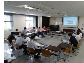
第2回上尾市かわまちづくり勉強会