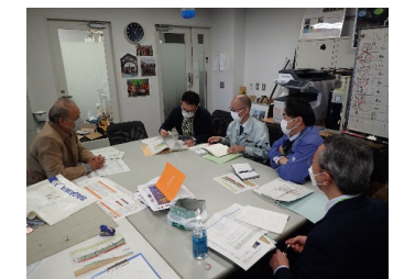
国・市・学識者協議 (11/14)