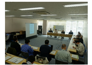
第4回上尾市かわまちづくり勉強会