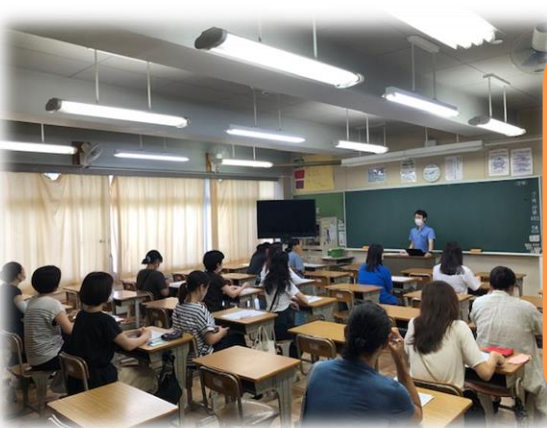
7月14日(金)、クラス保護者会が行われました。1学期のクラスの様子を担当からお話しさせていただきました。家庭での様子を保護者の方からお聞きすることができ、大変有意義な時間となりました。御多用の折、御参会いただき、ありがとうございました。