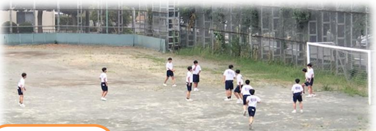
7月13日(木)、昼休みに元気よく校庭で遊んでいる生徒たちの様子です。短時間ですが、楽しそうに気分転換が出来ているようです。