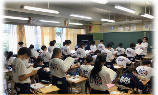
7月12日(水)、国語の「詩の世界」という授業で「表現」について学習している様子です。教科書を手に持ち、一生懸命に取り組んでいる姿はとて素晴らしいです。