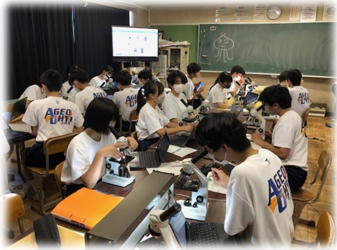
7月12日(水)、理科の授業の様子です。顕微鏡を使いながら何かを観察しています。その形が黒板にある「タコ」みたいな形になるようです。全員が興味深く観察を続けていました。