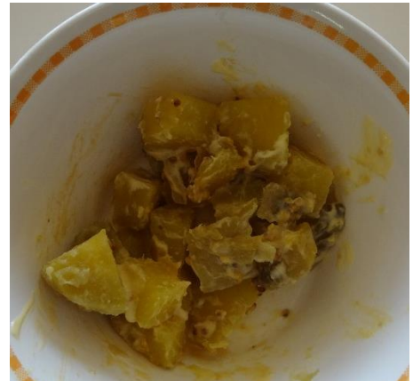
さつまいものつぶマスタードあえ