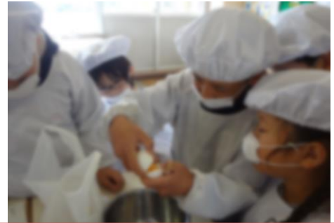
きみ しるみ と白身を分けることにも わ 挑戦 ちょうせん