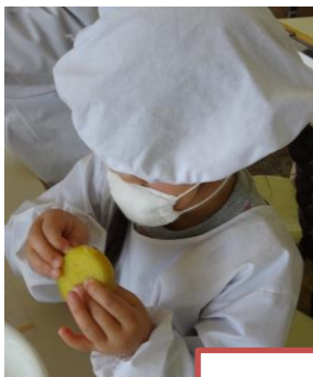
かわ か 皮をむいて