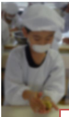
ほそなが な 細長くして