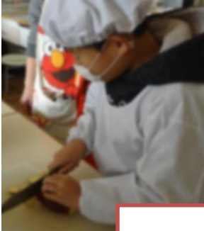
さつまいも き を切って