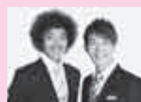
トータルテンボス