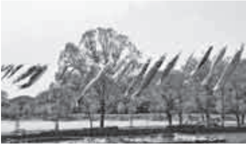
上尾丸山公園に掲げたこいのぼり(昨年)