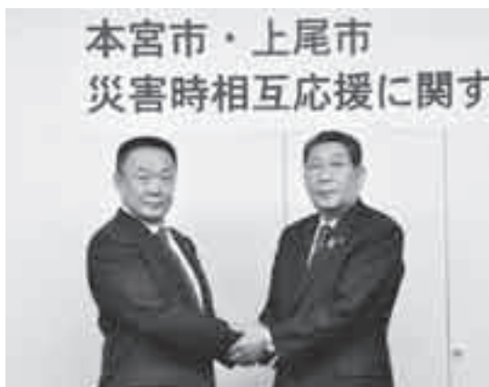
4自治体・24民間団体と防災協定などを締結

億円を削減するとともに、平成23年度の主要3基金(貯金)の残高は、過去15年間で最高となる約45億円が確保される見込みになりました。これも市民の皆さんのご理解とご協力によるものと、心から感謝を申し上げます。