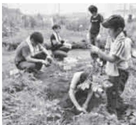
昨年の親子野菜作り教室

▼申し込み 往復はがきに教室名、住所、氏名、学校名、学年、電話番号、参加人数を記入して、3月12日(月)まで(必着)に農政課(〒362-18501本町3-1-1)へ