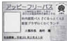
アッピーフリーパス

▶申し込み 申請書(市民安全課<市役所4階>にある)、本人が確認できる書類(運転免許証、健康保険証など)、利用者の写真(縦3×横2.4寸)1枚(本人が窓口に来られる場合は、なくても可)を用意して、直接市民安全課へ