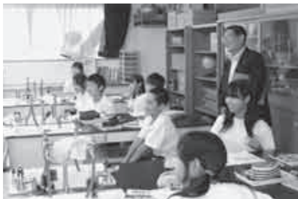
次世代を担う子どもたちの健やかな成長を願っています(学校訪問で)