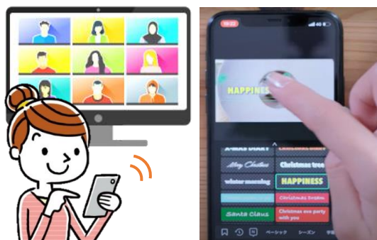
▲スマホで1分のPR動画を作成▲