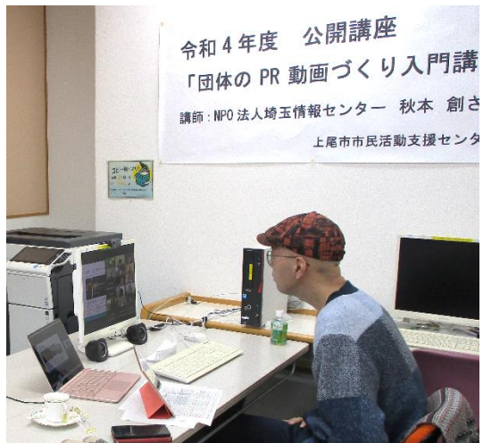
▲「Zoom」でのオンライン開催

今回作成したPR動画を配信することで、団体の活動をより多くの人に知ってもらい、一緒に活動する仲間を集める一助になればと考えています。