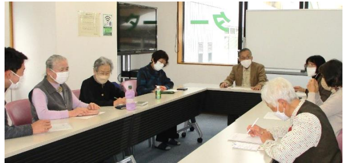
▲和気あいあいとした歌会の様子