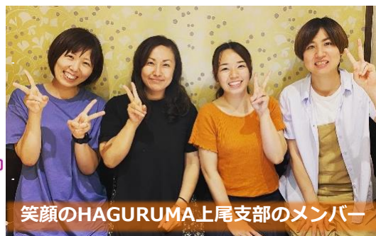
笑顔のHAGURUMA上尾支部のメンバー