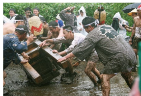
平方祇園祭のだろいんきょ行事

だろいんきょとは、いんきょ神輿と呼ばれる装飾のない白木の神輿を、あらかじめ水をまいておいた神酒所の庭で転がすことをいいます。いんきょ神輿も転がす若い衆も泥だらけになりながら行うこの祭りは、平成23年3月18日に県指定無形民俗文化財に指定されました。