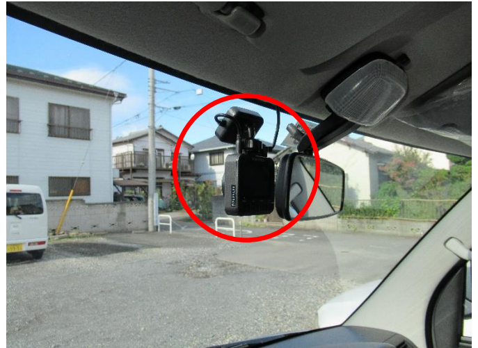
公用車へのドライブレコーダー設置