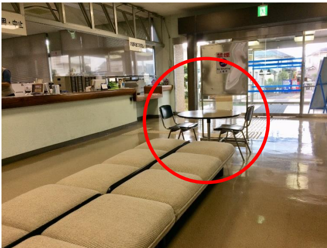
打ち合わせスペース（1階ロビー）