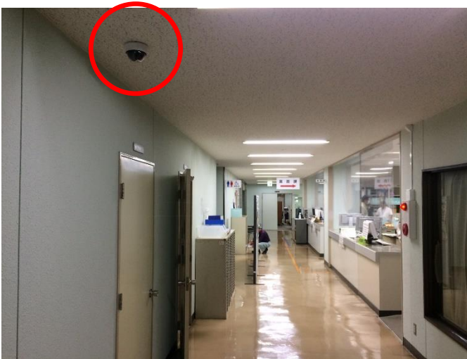
防犯カメラの設置（業務課）