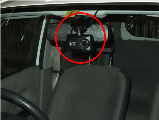
公用車へのドライブレコーダー設置