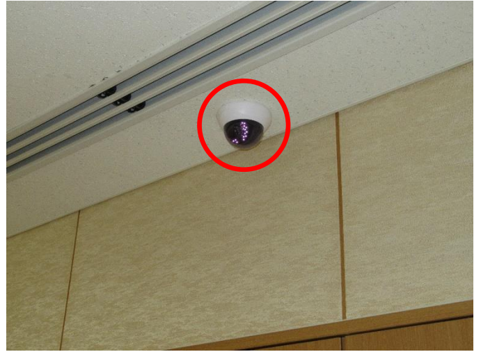
防犯カメラの設置（市長室）