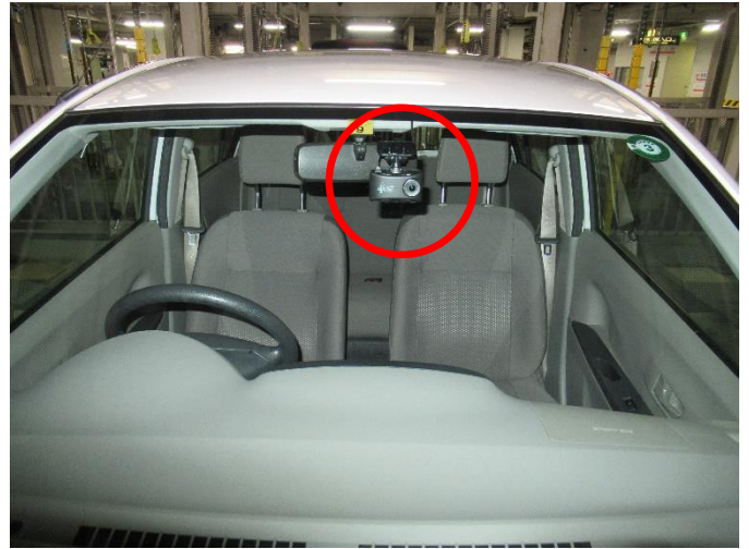
公用車へのドライブレコーダー設置