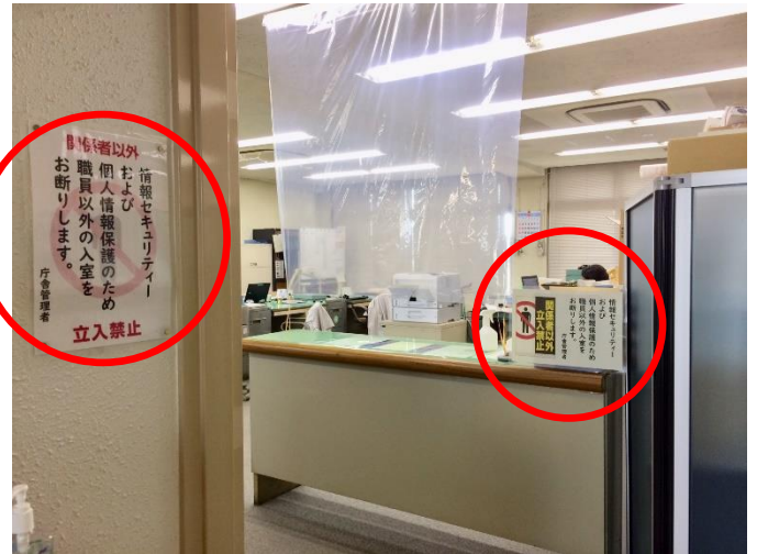
執務室への立ち入り制限（経営総務課）