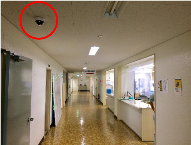
防犯カメラの設置（水道施設課）