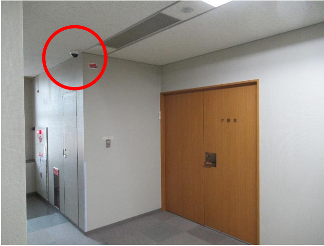
防犯カメラの設置（3階）