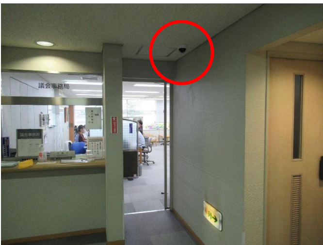
防犯カメラの設置（議会棟）