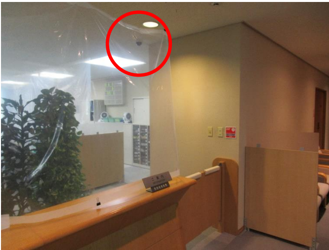
防犯カメラの設置（秘書政策課）