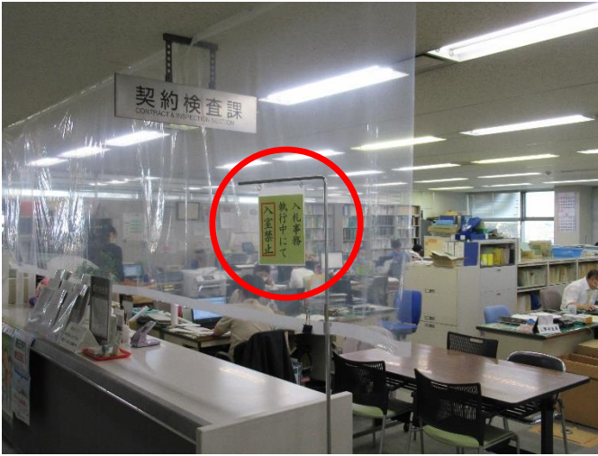
執務室への立ち入り制限（契約検査課）