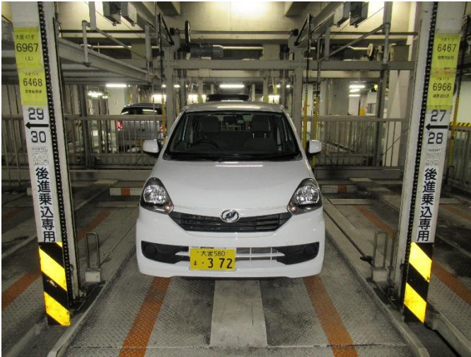
公用車へのドライブレコーダー設置