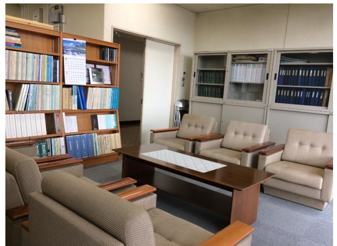
打ち合わせスペース（2階部長室）