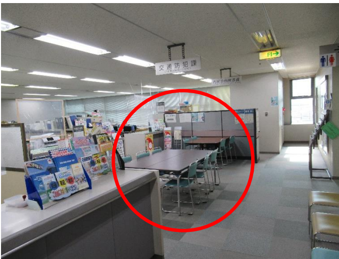
打ち合わせスペース（4階）