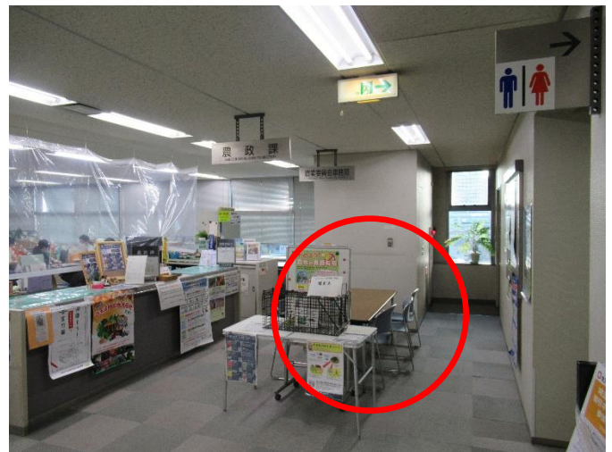
打ち合わせスペース（5階）