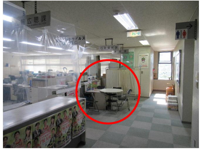
打ち合わせスペース（3階）