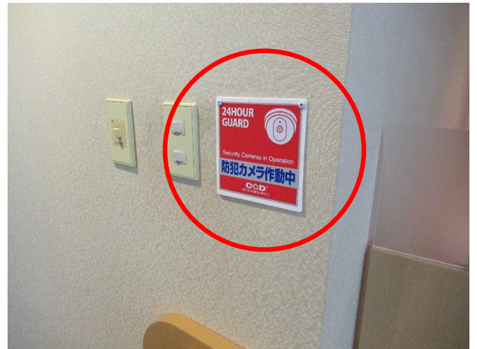
「録画中」を示すステッカー（秘書政策課）