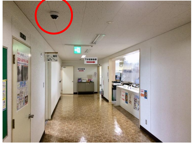
防犯カメラの設置（下水道施設課）