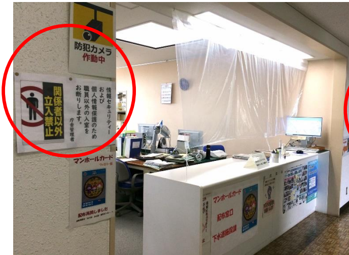
執務室への立ち入り制限（下水道施設課）