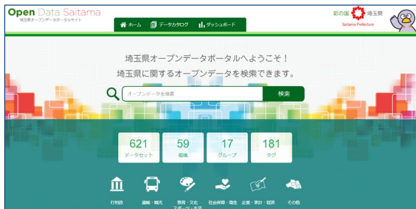
埼玉県オープンデータポータルサイト