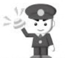
住警器設置推進シンボ ルキャラクター「消太」