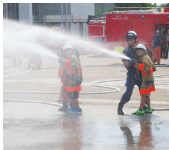
一昨年の夏休み一日消防士

時①7月22日(祝)～30日(金)8時30分～17時30分は12時まで②7月30日～8月9日(祝)8時30分～17時30分は15時から③8月3日(火)～10日(火)10～17時(8日(祝)・9日を除く、3日は13時から) 所①原市民館②平方公民館③市役所ギャラリー 閩市民協働推進