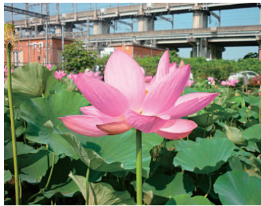
原市沼蓮池のハスの花