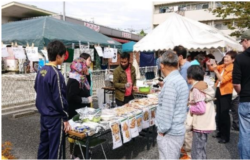
【各国料理の販売の様子】

ステージでは防災戦隊マモルンジャーのショーやファッションショーが行われ、観客から歓声が上がりました。屋内では様々な国と地域の民族衣装や着物の着付け体験が行われました。また防災コーナーでは消防服の試着やVR体験など楽しく防災を学ぶ体験型の催しとなりました。