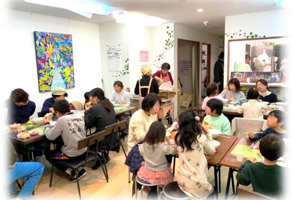
【ホットほっとタイムの子ども食堂の様子】