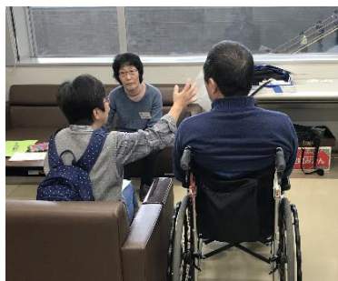
【成年後見相談会の様子】

介護サービスや施設入所の契約などのほか本人名義の不動産の処分、預貯金の管理・処分などを行う場合、認知症などにより契約ができなくなります。認知症になる前にあらかじめ任意後見契約をしておく、安心です。