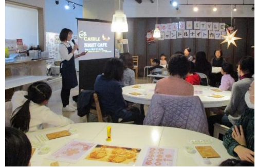
【キャンドルナイトカフェの様子】