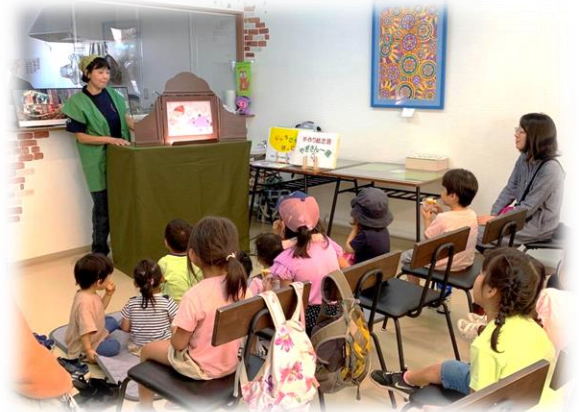
【紙芝居やぎさん一座の様子】