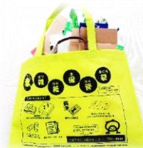
←【オリジナル雑紙保管袋】