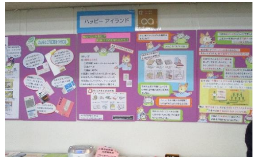
【上尾消費生活展でのブース】

ゴミの分別ゲームやクイズを通し、紙ゴミの分別のやり方を学んでもらい、毎日の暮らしの中で気軽に取り組めるよう、今回の協働事業で作ったオリジナル雑紙保管袋を渡しました。会場では、袋を下げた人でいっぱいになりました。