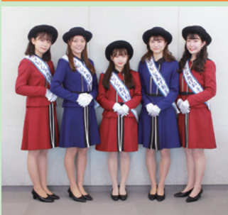
2021フレッシュあげお (P.19)