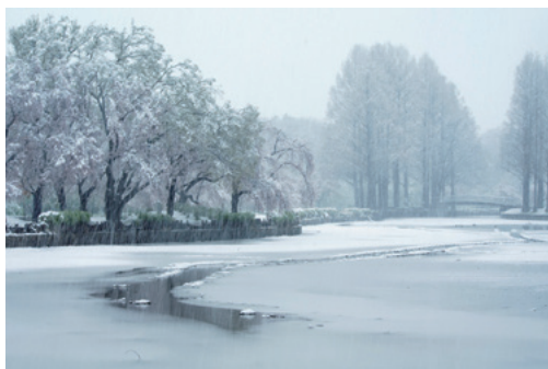
「名残の雪」 上尾市 「木瓜」さんの作品