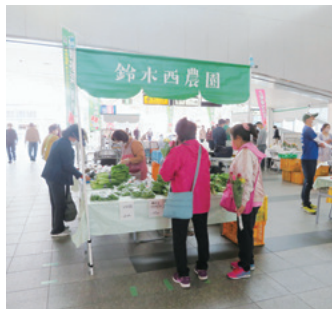
昨年のあげお朝市

市内で生産した農産物を農家が直接販売します。新鮮で安全な野菜、季節の花や果実、飲むヨーグルトなどを数多く取りそろえています。 時 毎月第4(土)10～12時 所 JR上尾駅自由通路 関 あげお朝市実行委員会(農政課内) 関 771-7384・関 771-9872