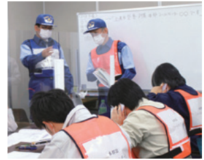
訓練の様子(2021年2月7日)