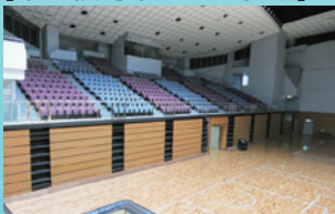
アリーナイメージ