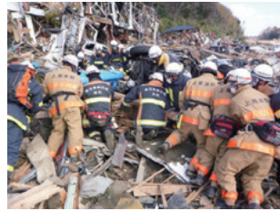
陸前高田市での救助活動(2011年3月)

一方、上尾市では、いつ起こるとも限らない災害に対し、過去の教訓を踏まえ、実践的な訓練を実施しています。本市においても一昨年（令和元年）東日本台風による被害が生じたことから、今回