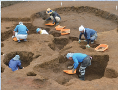
埋蔵文化財発掘調査