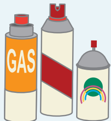
スプレー缶・カセットボンベ

飲料缶・スプレー缶の回収日に、集積所に出してください。その際は、必ずガス(中身)を使い切り、飲料缶とは別の透明な袋に入れてください。