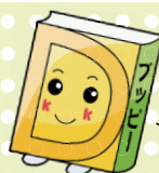
あっぴいぶっくるのキャラクター「アッピー」

子どもの読書活動支援センター 【開館時間】 10:00～16:30 所 柏座4-3-8富士見小学校内 TEL/FAX 773-3711