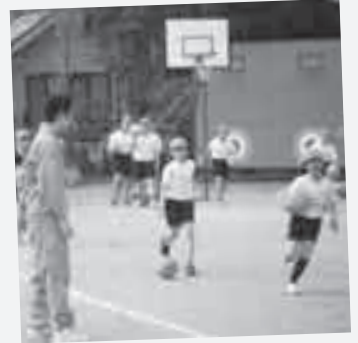
基本的な練習から教えてもらいます

紙に書いてありがとうボックスに入れます。それを鴨川小の児童に紹介します。いろいろすてきなありがとうがあって、とてもうれしです。これからもありがとうの気持ちを伝えていってほしいです。