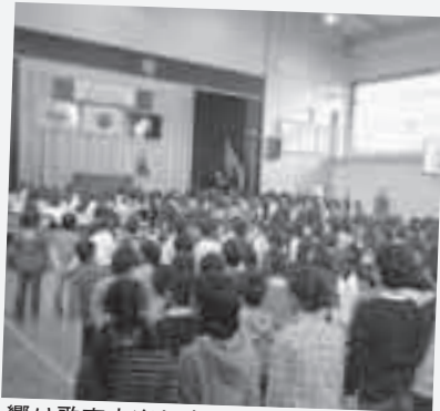
響け歌声音楽朝会