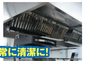
厨房設備は常に清潔に!

清掃、必要な点検及び整備など厨房設備の維持管理は「火災予防条例」で義務づけられています。