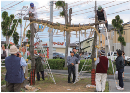
新しい大縄に架け替える「川の大じめ」(昨年)