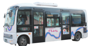
市内循環バス「ぐるっとくん」

高齢ドライバーの事故を防止するため、運転免許証自主返納者支援事業を実施しています。 ①市内循環バス「ぐるっとくん」の回数券（24回分）を交付 ②「運転経歴証明書」を取得した人に、その交付手数料（1,100円）を補助 ③次の(1)～(3)の全てに該当する人(1)令和2年4月1日以降に所有している全ての運転免許証を自主返納した(2)免許返納時に満75歳以上(3)市内に住所を有する ④運転免許証の自主返納後、申請書に運転免許証取消通知、写真付きの本人確認ができる物（取り消しを受けた運転免許証など）、運転経歴証明書、交付手数料の領収書、本人の振込口座の写しを添えて直接、交通防犯課へ ※代理人が申請する場合は、委任状と身分証明書を用意してください。