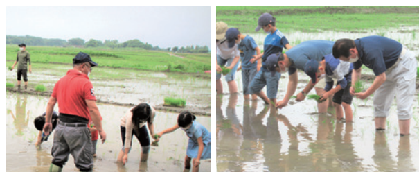
教わりながら親子で楽しく田植え体験 心を込めて植えこみました

6月14日、上尾市農業後継者育成確保推進対策協議会主催による親子農業体験教室「田植え」が開催され、私も参加させていただきました。