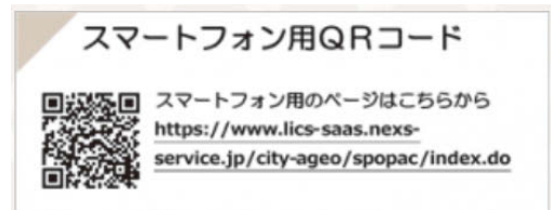
スマートフォン画面