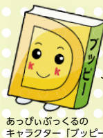
あっぴいぶっくるのキャラクター「あっぴい」

子どもの読書活動支援センター 【開館時間】 10:00～16:30 所 柏座4-3-8富士見小学校内 電話・773-3711