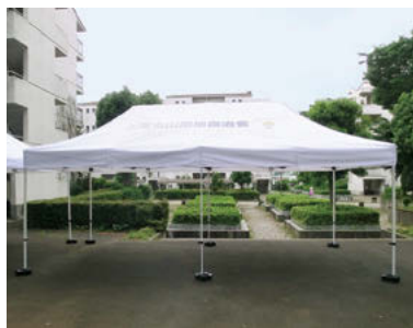
上尾丸山団地自治会に整備した集会所備品

(一財)自治総合センターでは、宝くじの社会貢献広報事業として、宝くじの受託事業収入を財源に、コミュニティ助成事業を実施しています。令和2年度コミュニティ助成事業の一環として、次の物を整備しました。 上尾丸山団地自治会／集会所備品 (テーブル、椅子、テントなど) 9・ 市民協働推進課 ☎75-4539・ ☎75-0007