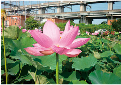
原市沼蓮池のハスの花