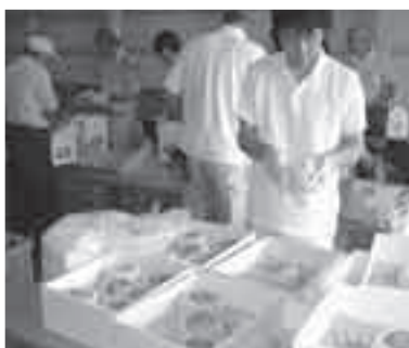
昨年のあげお朝市

市内農家が生産した農産物を直接販売します。新鮮で安全な野菜の他、梨やブドウなど旬の果物を数多く取りそろえています。8月は日本梨「彩玉」の上尾・伊奈ブランド「黄金の聖」の試食販売があります。 ▼とき 8月27日(土)午前9時～11時30分 ▼ところ 市役所正面玄関前 ↓あげお朝市実行委員会(農政課内、☎775-17384・☎775-9872)