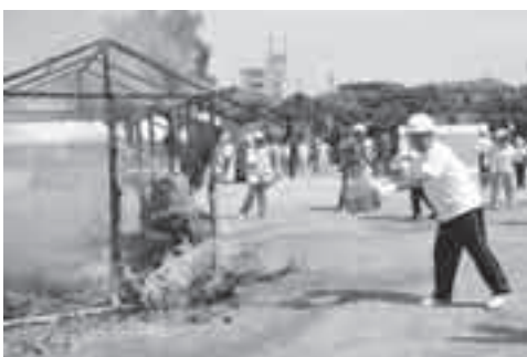
昨年の市総合防災訓練

地域の防災力を高めるために、地域住民の幅広い層の参加と、複数の関係機関が一致協力して訓練を実施します。