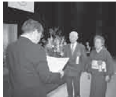
昨年の金婚式典・ダイヤモンド婚式典

※時刻表の停留所と時刻や運行ルートは、申し込み状況により変更する場合があります。帰りは、アトラクション終了後に文化センターを出発します。