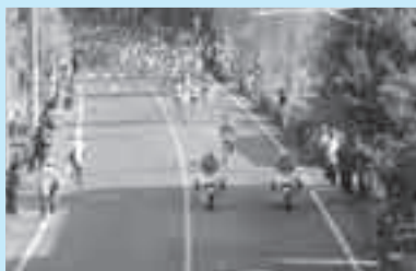
昨年の上尾シティマラソン

主催 市、市教育委員会、市体育協会、埼玉陸上競技協会 主管 上尾シティマラソン実行委員会