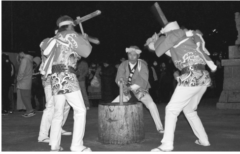
藤波の餅つき踊り