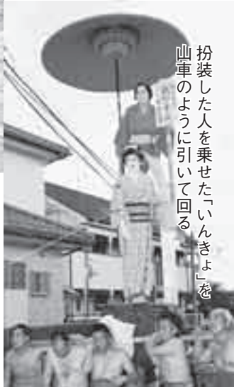
扮装した人に乗せた「いんきょ」を 山車のように引いて回る