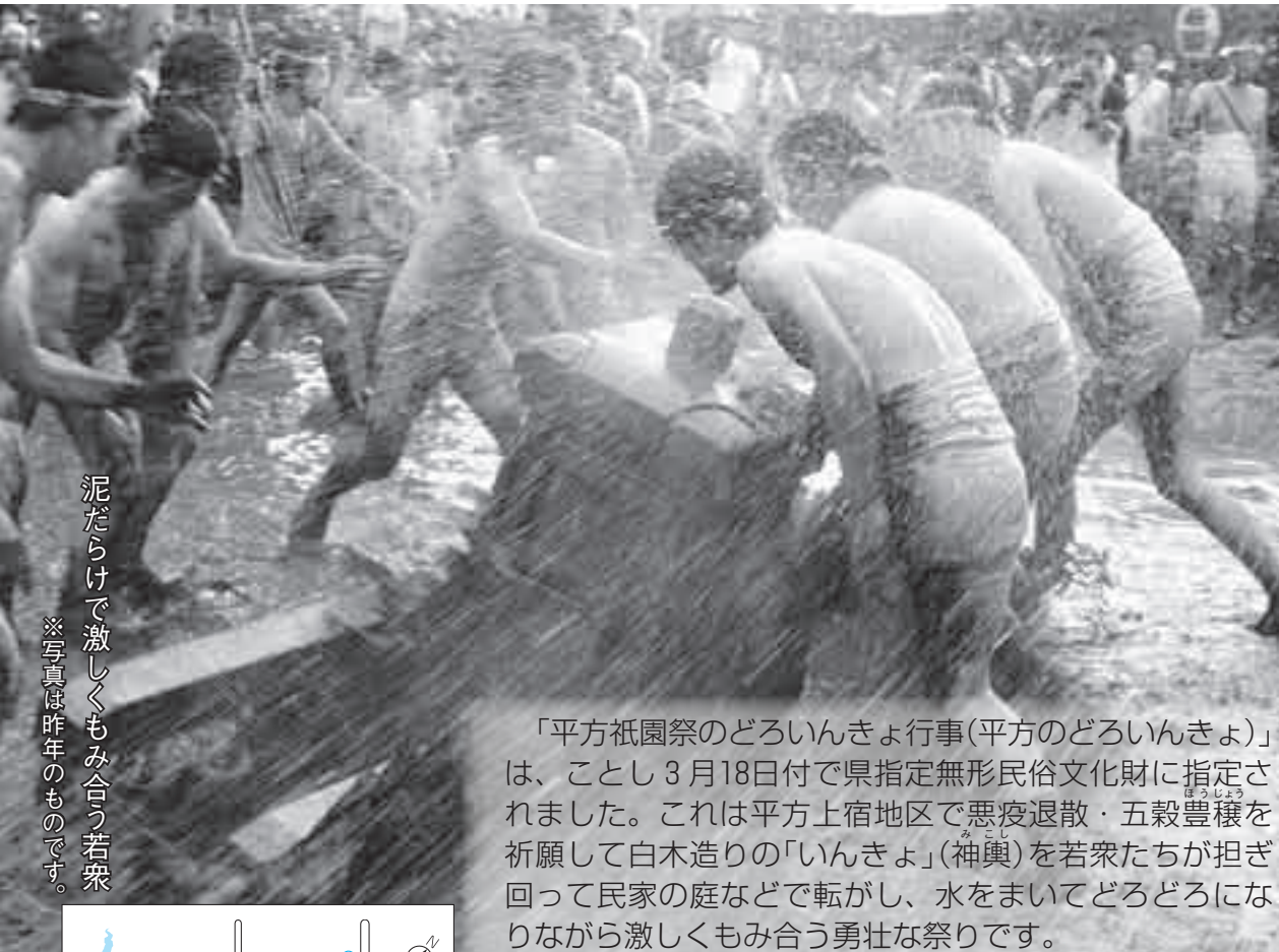
泥だらけで激しくもみ合う若衆