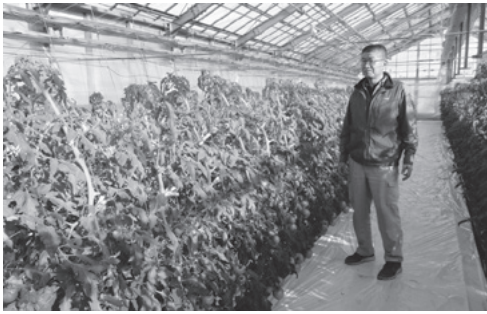
ハウス内のトマトは1段目が色付き始めたところ (1月初旬)