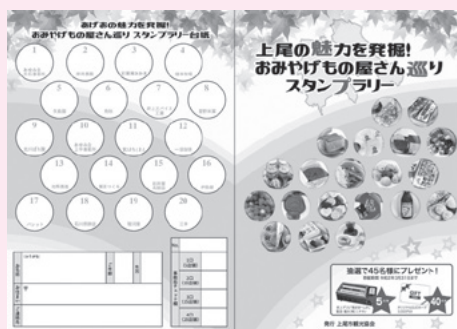
上尾の魅力を発掘！おみやげもの屋さん巡りスタンプラリー

エー・ジー・オー(A-G E Oタウン2階) ☎スタンプ5個/オリジナルクオカード3,000円分を40人、スタンプ10個/卓上グリル「焼きまへんか」を5人 【抽選申し込み】3月31日(火)までに直接、あげお お土産・観光センターへ