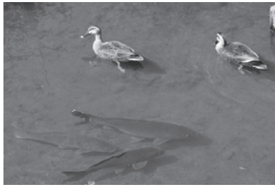
鴨川のコイとカルガモ

鴨川は荒川に合流する延長約19.2kmの一級河川で、そのうち約8kmが市内を流れています。桶川市に近い、かぶとの橋、新弁財橋の水辺は、地元有志の「鴨川を愛する会」や「鴨川水辺のサポーターの会」により「みんなで守ろう、身近な自然!」をモットーに「清流を取り戻し、子どもには安全な水遊びを、大人には癒やしの空間を」と毎年定期的な保全活動が行われています。