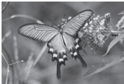
ビオトープにいるジャコウアゲハ

鴨川にもゴミや生活濁水が流れまわったり、外来生物のアカミミガメを見かけたりしますが、保全グループによると、カルガモやサギ、セキレイ、カワセミ、ミコアイサ、コイ、マルタウガイ、ナマズ、スッポンなどが20数年前に比べると多く見られ、ヨシ、イグサ、ガマ、ミソハギなども茂っているそうです。グループには「ホテルがあり、地域の人も見守ってほしい」とのことです。