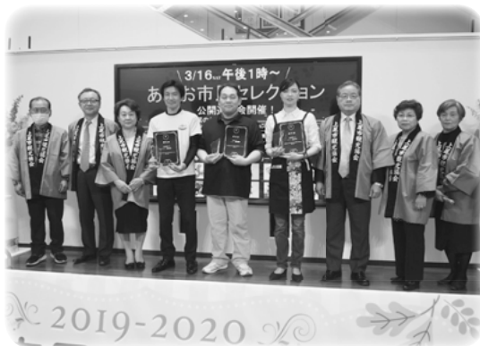
「2019-2020あげお市民セレクション」の受賞者(中央3人 左から 井上スパイス工業㈱、石川煎餅店、駿河屋)

あげお市民セレクションをはじめ、市観光協会推奨土産品は、「あげお お土産・観光センター」で購入できます。