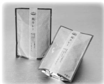
井上スパイス工業㈱「糀カレー」