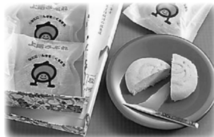
駿河屋「上尾さぶれ」

時とき 所ところ 内容内容 対対象 費用・金額 ※記載のないものは「無料」 定定員 持持ち物 ☑申し込み ※記載のないものは「当日、直接会場へ」 ☑問い合わせ