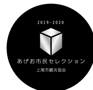
あげお市民セレクションの認定マーク