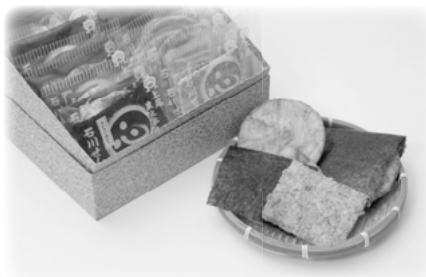
石川煎餅店「炭火本手焼」