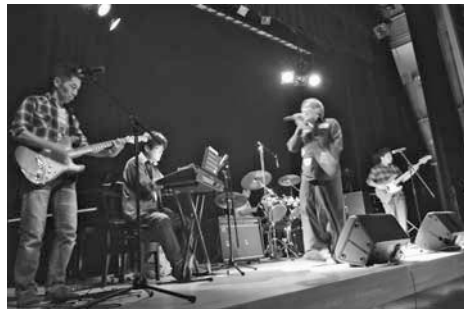
さまざまなジャンルのアーティストが出演

の資格がある人 ☎若千名の申請書(高齢介護課にある)に必要事項を記入して、6月30日(土)までに直接、高齢介護課へ ☎高齢介護課 ☎75-5126・☎776-8872