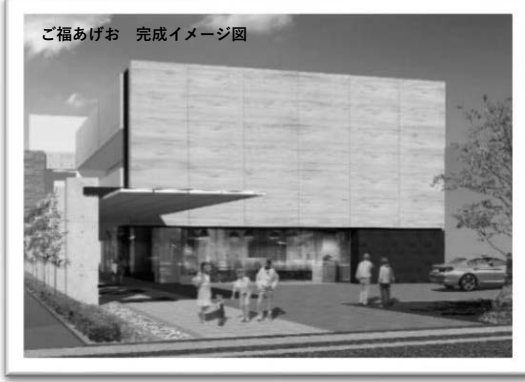
ご福あげお 完成イメージ図

●見守りシステム導入 各ベッドには、入居者様の睡眠の様子や居室の温度・湿度等が分かる見守りシステムを導入!安心・安全な生活を守ります。 ●24時間面会可能 お忙しいご家族も、時間を気にせず気軽に面会に来ていただき、「家族の時間」を大切にさせていただきます。