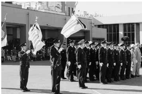
昨年の消防出初式

775-1500・☎775-2230 訓練展示他 ☎消防総務課☎ 所市消防本部 ☎消防車両と 消防職・団員の行進、消防署