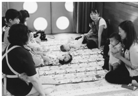
参加者同士で交流しながら親子で楽しめる子育てサロン