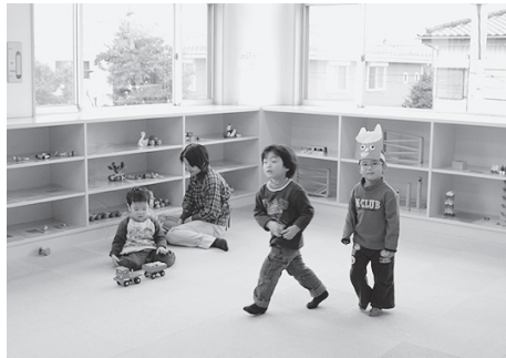
乳幼児相談センターのおもちゃ広場

つくし学園園庭 ▼内容 盆踊り、ゲーム、花火など ↓つくし学園(☎786-4493・☎786-6767) (財)県生態系保護協会 上尾支部の催し ①広場のアレチヌスビトハギ駆除作業 ▼とき 7月11日(日) ②ユウゲショウなどの外来植物抜き作業 ▼とき 7月18日(日) ③チガヤ群落のムラサキツメクサ抜き作業 ▼とき 7月25日(日) ④再生してきたオギ群落周辺の外来種抜き作業 ▼とき 8月1日(日) ①〜④共通 ▼集合 午前8時50分・東武バス西上尾車庫前 ▼ところ サクラソウトラスト地(領家)⑤ホトトギスの声を聞きながら外来植物抜き作業 ▼とき 7月29日(木) ▼集合 午前10時・三ツ又沼前(解散/午後1時ごろ) ▼ところ 三ツ又沼ビオトープ(平方) ①〜⑤共通 ※小雨決行。 ▼参加費 100円(保険料) ▼持ち物 昼食、飲み物、長靴、軍手、観察用具(持っている人) ▼申し込み 当日、直接集会場所へ ↓小川(☎781-0887)