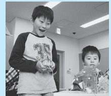
ロボットを動かそう

▶とき 8月1日(日)午前9時30分~11時30分 ▶内容 ロボットキットの組み立てと操作 ▶対象 市内に在住の小学2~4年生と保護者 ▶定員 12組(応募者多数の場合は抽選) ▶参加費 1組1,000円 ▶ところ 美術工芸室 ▶申し込み 往復はがき(1人<組>1枚)に住所、氏名、電話番号、学校名、学年、参加希望コースを記入して、7月19日(祝)まで(必着)に児童館こどもの城(〒362-0047今泉272)へ