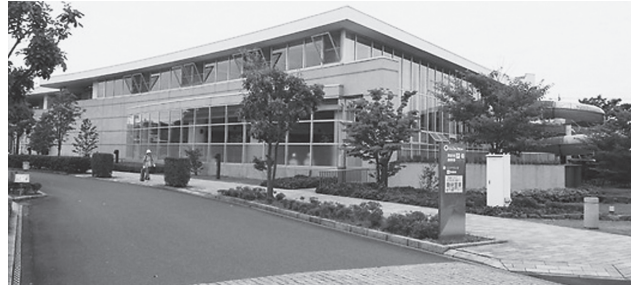
健康プラザわくわくランド

分からプール監視室前で受け付け 【①~④共通】 ▶対象 中学生以下を除く ※教室は各回当日だけです。 ▶参加費 入館料だけ 7月の休館日/毎週水曜日(21・28日を除く) ※21・28日(水)は午後7時に閉館します。 ご利用ください! 市内循環バス“ぐるっとくん”平方循環・東西循環で「わくわくランド」下車