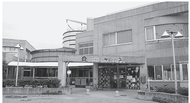
児童館アッピーランド

ご利用ください! 市内循環バス“ぐるっとくん”原市・上平循環で「アッピーランド」下車