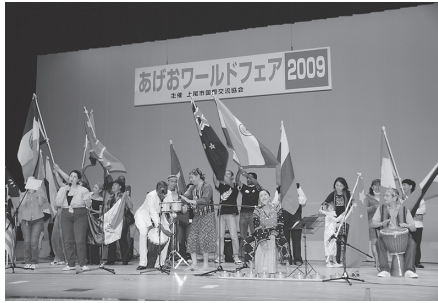
昨年のあげおワールドフェア

毎年秋に文化センターを会場に行われる「あげおワールドフェア」が、ことしは10月11日(祝)に開催の予定です。