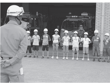
昨年の一日消防士たち

▼とき 8月5日(木)・6日(金)午前9時～午後4時 ▼ところ 市消防本部・東消防署 ▼内容 はしご車に挑戦、消防車出動訓練、放水体験、すぐに役立つ応急処置、実験ほか ▼対象 市内に在住の小学4～6年生(初めて参加する児童を優先) ▼定員 各35人(応募者多数の場合は抽選) ▼参加費 無料 ▼申し込み 往復はがきに希望日①5日②6日③どちらでも可、住所、氏名(ふりがな)、性別、学校名、学年、保護者氏名、電話番号を記入して、7月10日(土)まで(当日消印有効)に消防本部予防課(〒36210013上尾村537)へ ↓消防本部予防課(☎7751314・☎77512230)